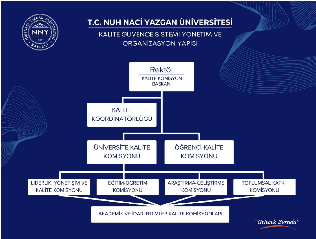
Şekil 2. Nuh Naci Yazgan Üniversitesi Kalite Koordinatörlüğü Organizasyon Şeması

Kalite Koordinatörlüğü, Kalite Komisyonu ve alt komisyonlar aracılığıyla yürütülen kalite süreçleri, kurumsal iletişim mekanizmaları ile desteklenmektedir.